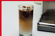
アイスカフェラテ